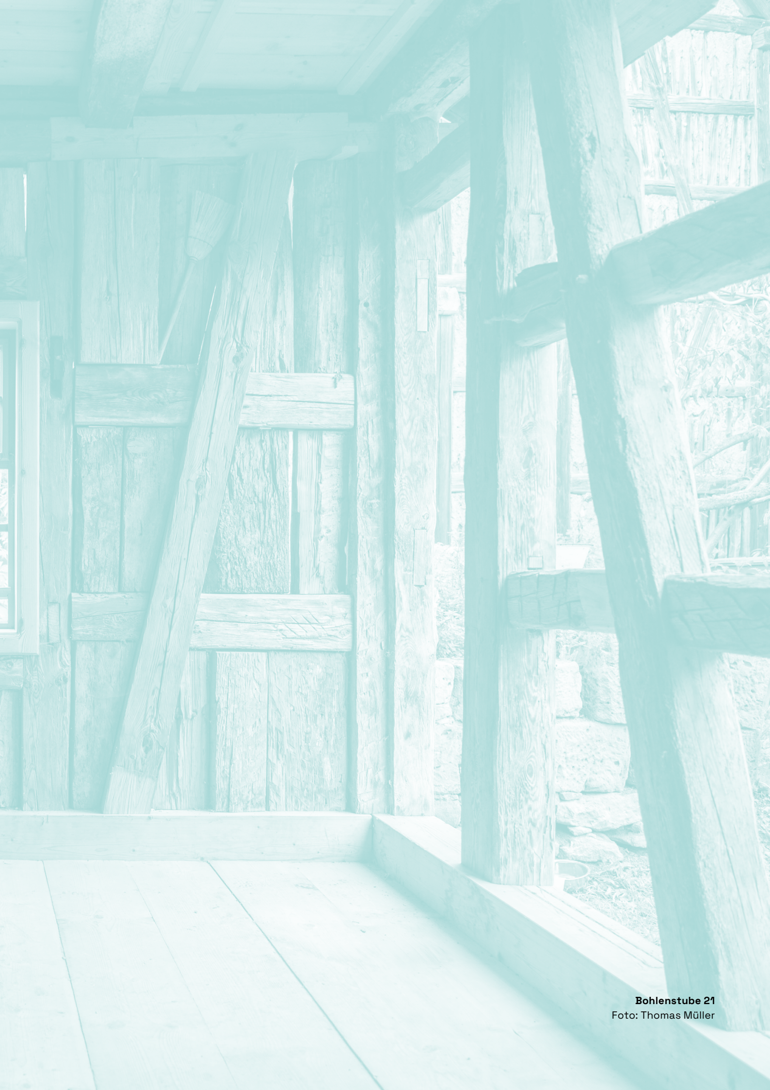
Bohlenstube 21