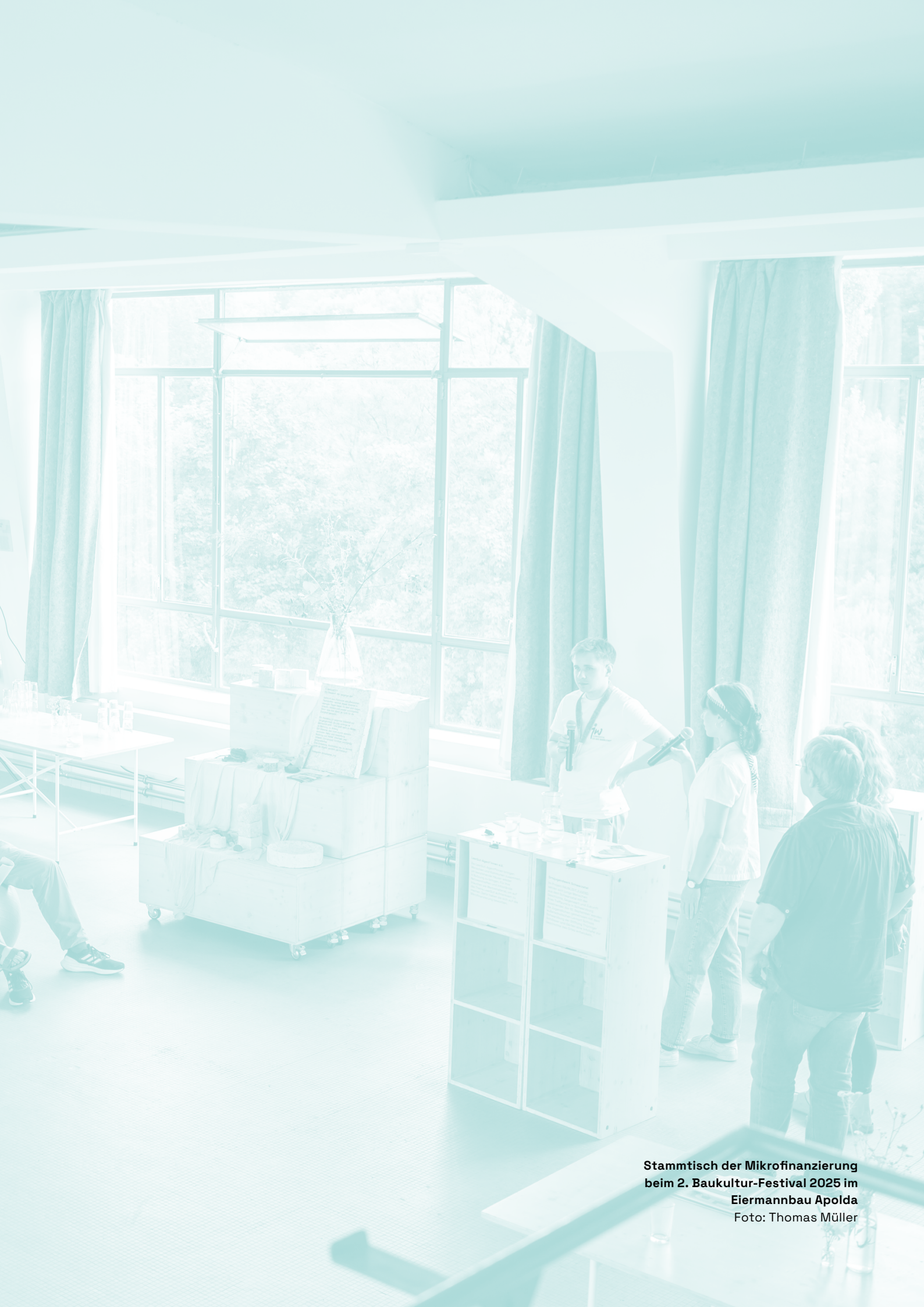
Stammtisch der Mikrofinanzierung beim 2. Baukultur-Festival 2025 im Eiermannbau Apolda